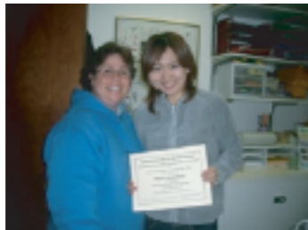
就職後に役立つことをたくさん教えてもらいました。

就職後に役立つことをたくさん教えてもらいました。 仕事の内容はきっちりと決まっていな分、自 分で仕事を見つけることが最初はしんどいこともありましたが、自分の動き方、働きかけ次第で可 能性はいくらでも開けるということを再認識することができました。施設ではとにかく誰かに話 かけ、1分でも多く会話の機会を作る努力をしました。そのお陰で6週間でもずいぶんリスニング 力が伸びたと思います。今回の経験を今後の福祉視察の添乗に役立てることができたらいいな、 と思っています。とても貴重な体験ができました。