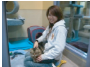
ネコの個室に行き一緒に遊びました。

1週間に20時間というペースで、週4日ボラン ティアに入りました。私はネコが好きなので、 主にネコのお世話をしていました。毎回動物 たちとふれあうことができ、何より楽しかった です! 仕事の内容は、ネコのトイレ掃除、一 緒に遊ぶ、洗濯など、自分の家で飼っていたネ コのお世話とほとんど変わりませんでした。初めはスタッフがトレーニングをしてくれて、毎回ス タッフと一緒に仕事をしました。やることのない時には、自分から「○○やってみたい!」とス タッフにお願いをして、いろいろチャレンジすることもできました。また、時々人手が足りなくて犬 の散歩を手伝うこともありました。ボランティア先の回りが高級住宅地なので、犬の散歩をしなが ら、いろいろな景色を見ることができて楽しかったです。