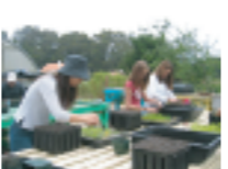
みんなで苗木栽培のお手伝い