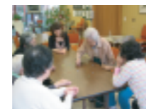
日本の「おはじき」が人気。