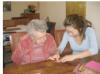
おりがみて何か作ってプレゼントすると喜ばれます

仕事の内容はきっちりと決まっていな分、自 分で仕事を見つけることが最初はしんどいこともありましたが、自分の動き方、働きかけ次第で可 能性はいくらでも開けるということを再認識することができました。施設ではとにかく誰かに話 かけ、1分でも多く会話の機会を作る努力をしました。そのお陰で6週間でもずいぶんリスニング 力が伸びたと思います。今回の経験を今後の福祉視察の添乗に役立てることができたらいいな、 と思っています。とても貴重な体験ができました。