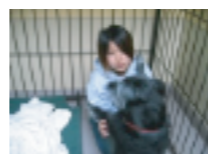
犬と一緒に遊ぶことも仕事