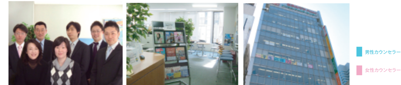
グローバルスタディの留学カウンセラー達