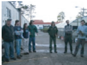
終わりの会で今日の達成成果を報告しました。

沼地の外来種の伐採作業に参加しました。沼 地用の防水ズボンとジャケットを着て作業を し、いきなりスタッフの一員になれた気分です た。作業はすごく大変でしたが、一般客が入れ ないようなところにも入れてワクワクしまし た。作業をしながらスタッフや他のボランティ アの人たちと仲良くなれたことが、とても良かったです。僕は特にリスニングが弱かったため、リー ダーの指示や説明を理解したり、注意点を理解することのにも苦労しました。でも、理解でき なかつた時は他のボランティアの人が植樹の仕方など実演して教えてくれたので、逆に会話をす るきっかけにもなりました。同世代のアメリカ人は何となく大人っぽく見えて近寄りたかったの ですが、実はあまり変わらないということに気づきました。